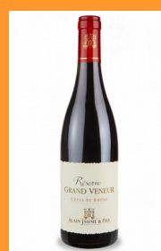
Côtes du Rhône « Grand veneur », Alain Jaume 50cl 14€