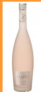
Miraflore rosé 50cl IGP Côts Catalanes 15,50€